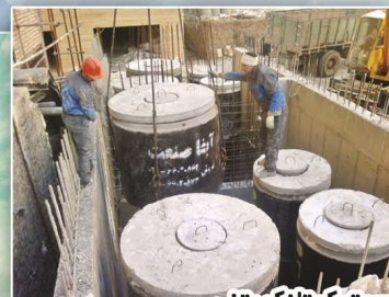
سپتیک تانک بتنی