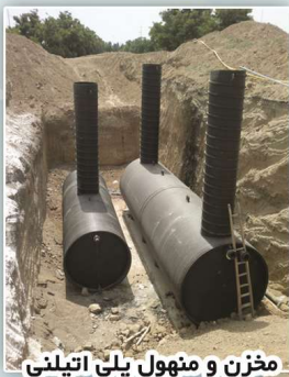
مخزن و منهول پلی اتیلنی

مشاوره، طراحی، ساخت و اجرای سیستم های تصفیه آب و فاضلاب