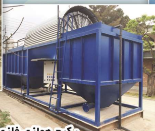
پکیج هوازی فلزی